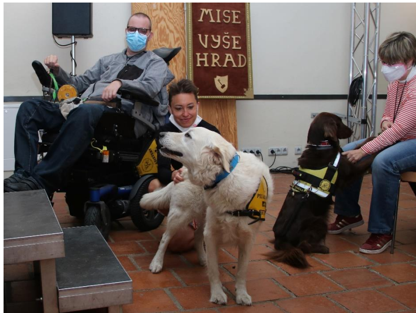
Praha – Vyšehrad, 22.9.2020